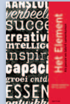
Het Element | Ken Robinson | 9789049100261 | € 24,99

Dit boek is een lofzang op de adembenemende diversiteit van menselijke talenten en passies en ons buitengewoon potentieel voor groei en ontwikkeling. Op zijn eigen bevlogen manier zet Robinson de lezer aan tot denken en inspireert hij iedereen om het Element te vinden.